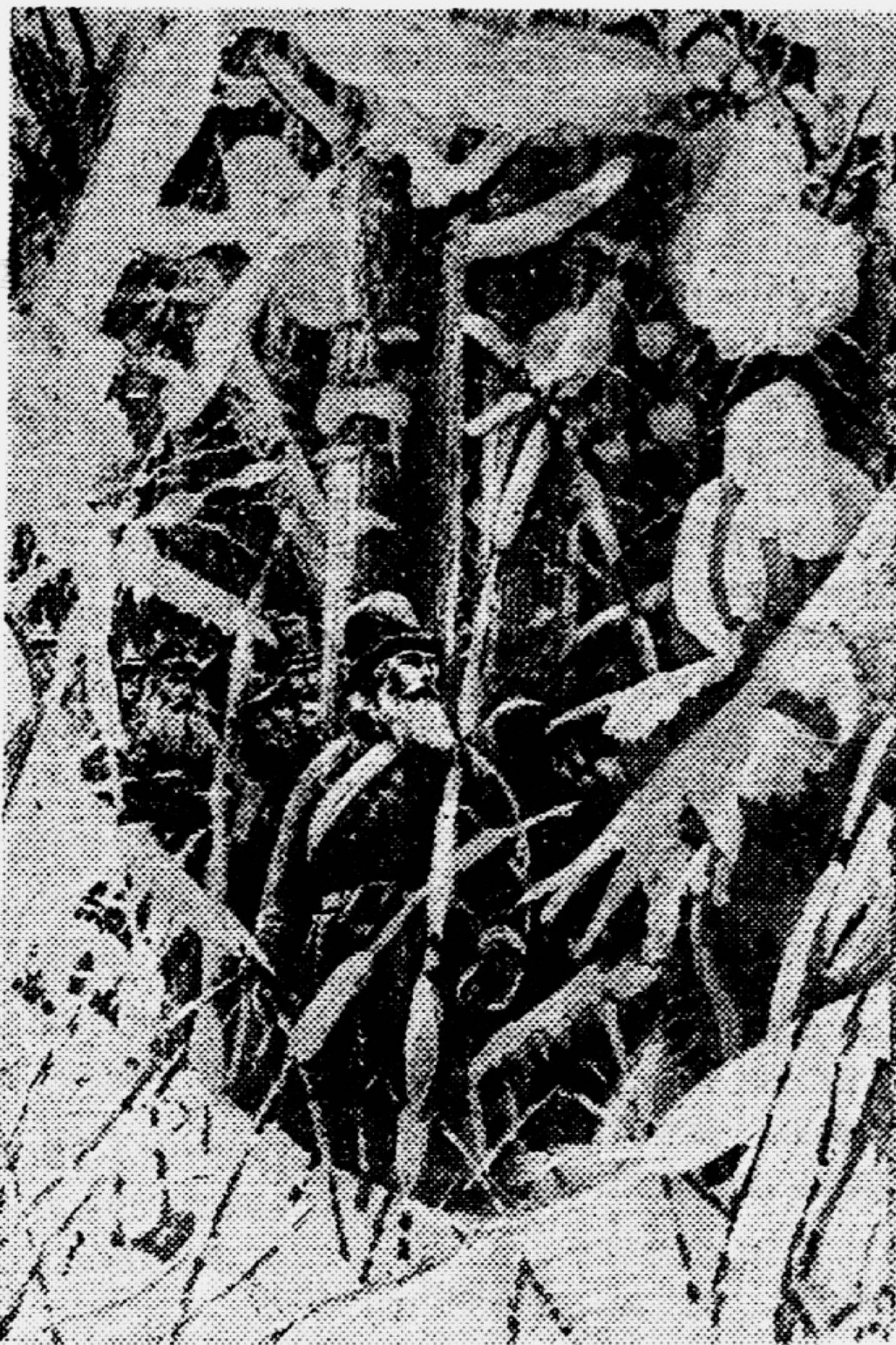
«Не замай — дай подойти» — картина В. В. ВЕРЕЩАГИНА, посвящённая партизанам Отечественной войны 1812 года.

Верещагин был храбрым и мужественным человеком. Он участвовал в трёх войнах. Люди, знавшие его, рассказывали, как художник не раз шёл навстречу смерти с оружием в руках. В 1868 году, во время войны в Средней Азии, Верещагин под свирепым