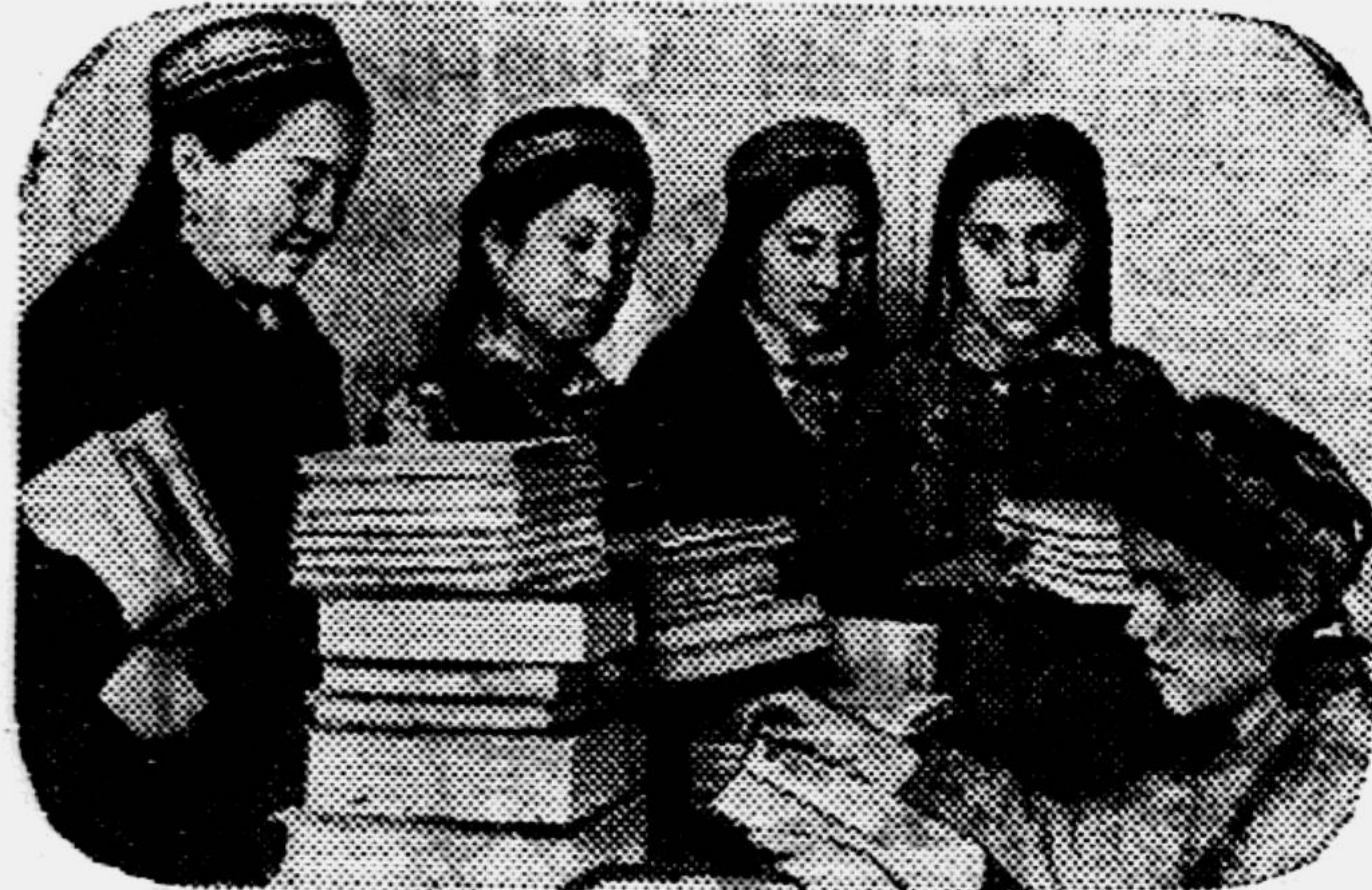
Эти книги бухарские школьницы посылают своим друзьям — детям освобожденных районов.