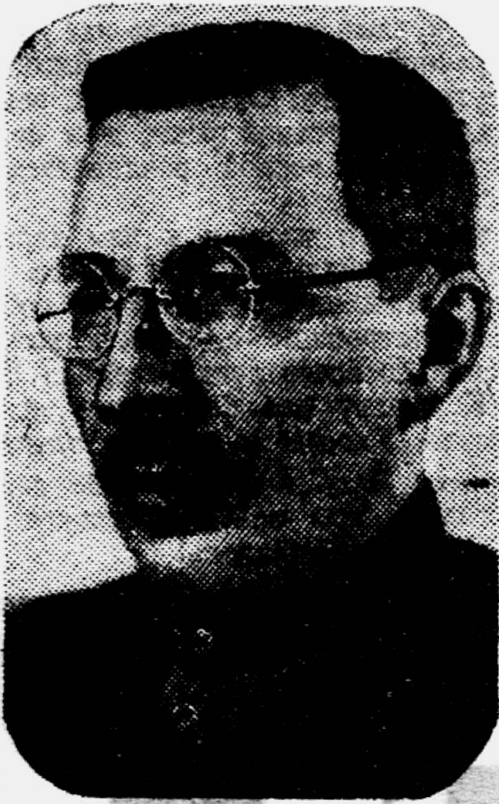
А. С. МАКАРЕНКО.

Антон Семёнович был для меня и для других не только учителем, но и отцом. В последнее время, когда мы, уже взрослые, сблизились со всех концов к нему в Москву, мы так и называли его: отец.